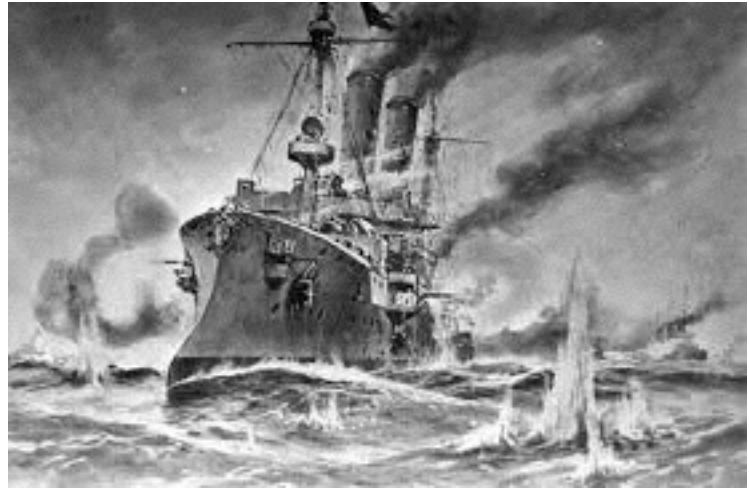
Batalla de Heligolande.

En este momento, los británicos quieren cortar su retirada y comienza un duro combate entre el crucero británico Arethusa contra el buque alemán Ariadna , al mismo tiempo que el Fearless hacia frente al Strasbourg alemán. Dándose cuenta los alemanes de la situación delicada por la que estaba pasando sus barcos envían dos nuevos buques de línea,